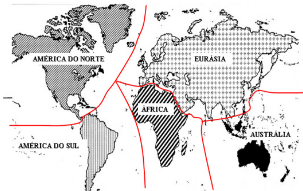
APÊNDICE 2 – Mapa da Visão Geopolítica Mundial de Spykman

* Major do Serviço de Material (Eng). Professor do Instituto de Estudos Superiores Militares.