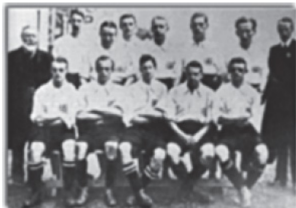
Foto da Eq. Inglesa vencedora do torneio de futebol dos Jogos Olímpicos de 1908.

Graças ao conceito da livre e fácil representatividade, banqueiros, comerciantes e industriais estão na origem da maior parte dos clubes que se espalharam por toda a Europa entre 1890 e 1910. É neste período que surge, em 1904, a FIFA, à qual iremos dedicar especial atenção em área própria deste artigo. Quatro anos depois surge a primeira competição internacional administrada e organizada pela FIFA, mas integrada nos Jogos Olímpicos de Londres de 1908. Esta foi ganha pelos “inventores” do jogo, a Inglaterra, que viria a repetir o triunfo nos Jogos Olímpicos de Estocolmo em 1912.