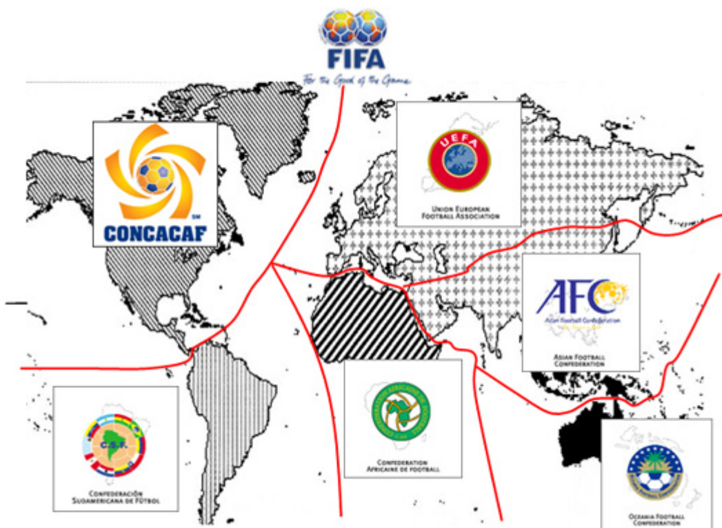
APÊNDICE 1 - Distribuição Geográfica das Confederações da FIFA

2 - Mapa da Visão Geopolítica Mundial de Spykman