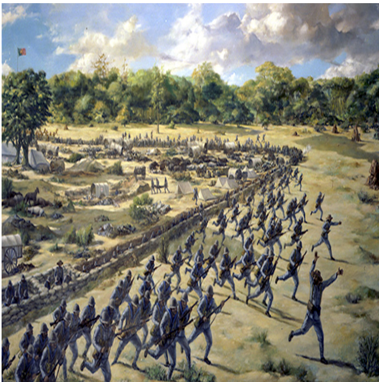
Óleo de Pedro Cruz. Museu de Marinha (PN-I-136)

A pequena, mas importante, vitória de Tchipelongo, moralizou as forças portuguesas que decidiram avançar para Sul em direcção ao Cuamato e Cuanhama.