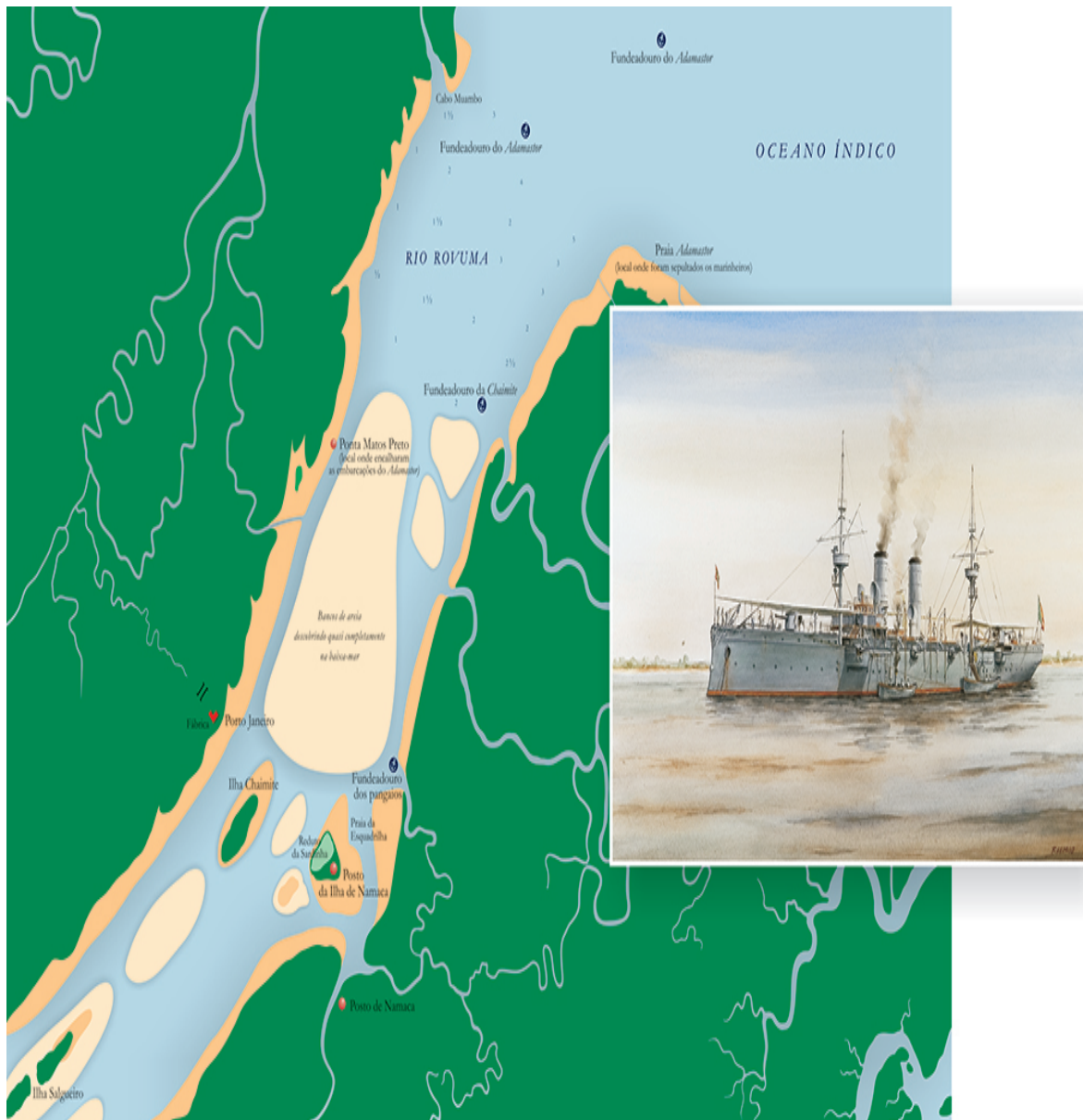
Desenho de José Cabrita, segundo esboço da esquadilha de embarcações do Adamastor . Cruzador Adamastor , aguarela de Fernando Lemos Gomes. Museu de Marinha